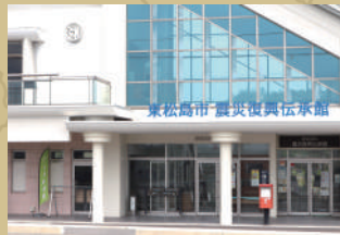
東松島市震災復興伝承館