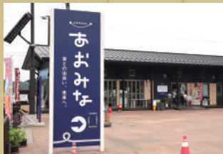
あおみな（奥松島遊覧船案内所）